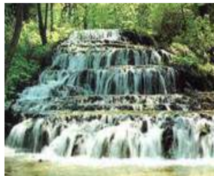
A szalajka-völgyi fátyol-vízesés

A közelben található a lázbérci víztározó, a szénégetők különleges birodalma.