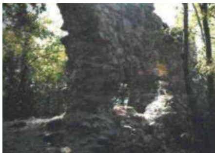
A Dédes vár romjai

panoráma tárul elénk. A dédesziclák a hegymászók kedvelt gyakorlólhelye.