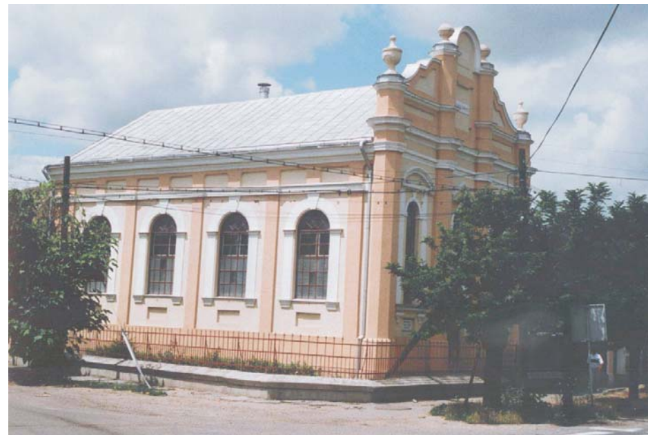
A nagyszalontai magyar baptista imaház - foto: Bagosi Imre

(Csoják Attila: Képek a magyarországi baptista misszió történetéből , Budapest 1928.) (Tóth Mihály Lapok az Interneten)